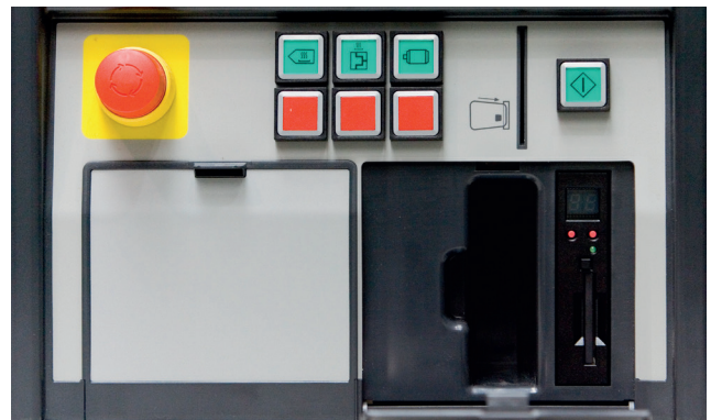
Control con nuevo módulo CompactFlash