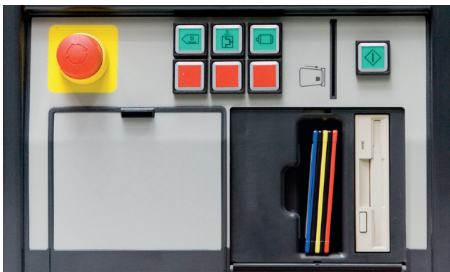
Control con disquetera antigua

Debido a la compatibilidad absoluta no es necesario un cambio de sistema general a la hora de cambiar de disquetera a CompactFlash. Para esta operación, suministramos con el módulo una tarjeta CompactFlash (Industrial Grade) con el software actualmente instalado en su máquina y una tarjeta vacía para sus datos de moldes.