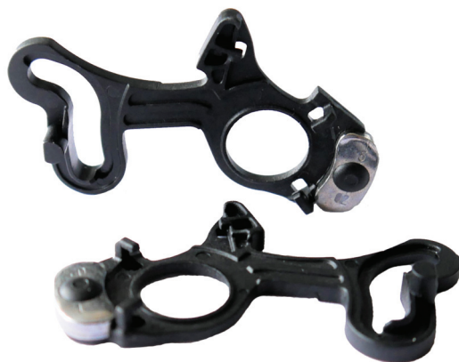
Двухкомпонентные рычаги привода

работчика полимерных материалов, в данном случае компанию SuK Kunststofftechnik, но и производителя литьевого оборудования – компанию Sumitomo (SHI) Demag – на пути к бездефектному производству (и не только на полностью электрических литевых машинах).